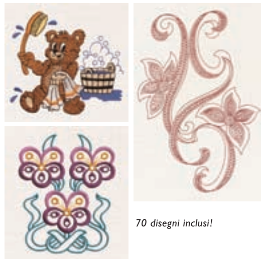
70 disegni inclusi!

La tensione del filo dell'ago della Platinum 955E si imposta automaticamente