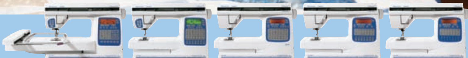
PLATINUM 955 E