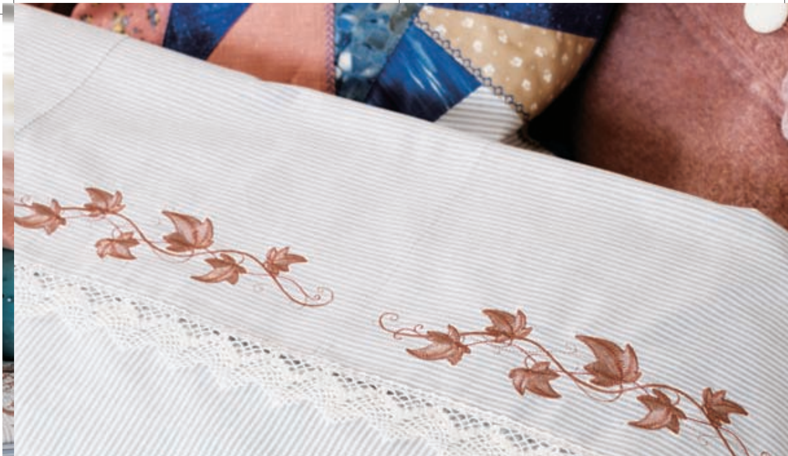
Questo bellissimo lenzuolo è decorato con un disegno in dotazione alla Platinum 955E.

per ogni tecnica di cucitura. Non devi più procedere per tentativi. Grazie al sensore del filo dell'ago, la macchina interrompe automaticamente la cucitura e il ricamo se il filo termina o si rompe.