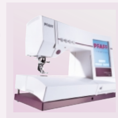
Cuci come i professionisti con la Pfaff Creative 2170 !

Basta sforzarsi gli occhi con la cruna dell'ago! L'infilatura incorporata rende l'infilatura facilissima.